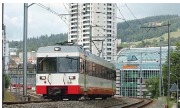
Le petit train qui relie La Chaux-de-Fonds et Les Ponts-de-Martel (ici en 2005) sera remplacé en 2023.

Cette nouvelle halte sera construite à Malakoff, à proximité immédiate de l'ancien pont ferroviaire qui vient d'être détruit et où un nouveau sera prochainement reconstruit. Cette nouvelle halte sera d'ailleurs fréquentée par de nouvelles rames TransN. Il s'agira de «matériel neuf compatible avec la mise aux normes pour les personnes han-