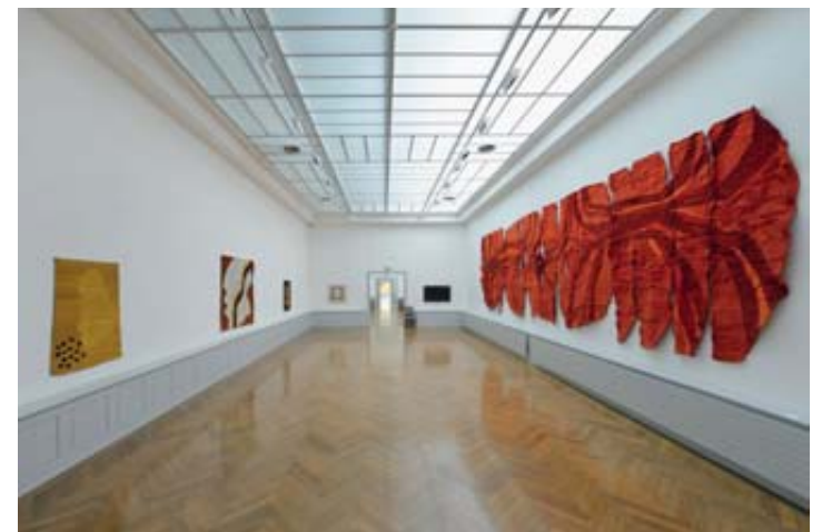
A droite, la tapisserie géante «Jusqu'au cœur» qui orne, en temps ordinaire, un mur de la Haute Ecole d'ingénierie du Locle. ALINE HENCHOZ

de l'Europe de l'Est. «Plus basiques mais qui suivent l'évolution.» Evoluer, justement, lui tient à cœur. «Il faut cependant savoir rester soi-même.» L'évolution des tendances dans l'art, Jeanne-Odette la guette. Avec des amis, elle continue de sillonner les cantons et les pays à la découverte de musées et d'expositions. «Bon, là, vu la situation liée au coronavirus, on attend de repartir quand on pourra