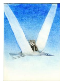
Le Chat Muche - Stasys