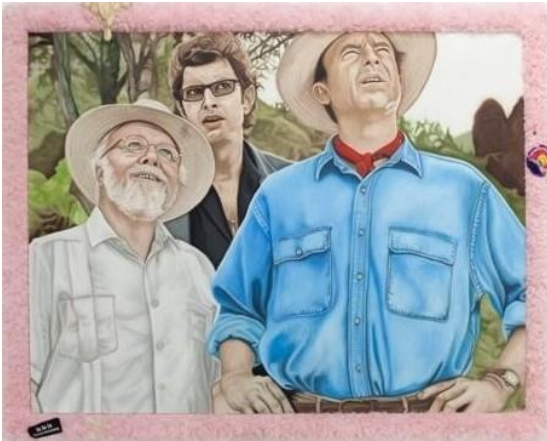
Yoan Mudry, Jurassic Parc , 2023, huile, acrylique et technique mixte sur toile, 97 x 129 cm

Dans ce paysage d'Edouard Jeanmaire, les vaches du premier plan sont extrêmement détaillées et montrent des couleurs vives, alors que la partie gauche du tableau semble plongé dans la brume, car plus distant.