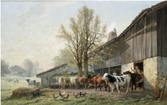
Edouard Jeanmaire, Sortie de l'étable , 1880, huile sur toile, 142 x 227 cm