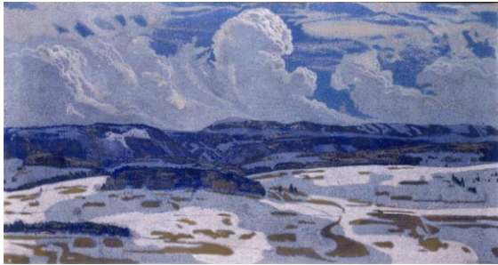
Charles L'Eplattenier, Temps de mars , 1907, tempera sur toile, 105 x 195 cm, Musée des beaux-arts de La Chaux-de-Fonds

Point de départ de l'exposition, ce tableau a été réalisé en 1907 par Charles L'Eplattenier. Il représente un paysage jurassien au ciel tourmenté, où la fonte des glaces semble avoir tout juste commencé. Le format panoramique s'adapte à l'ampleur du paysage représenté. Le paysage est composé par des petites touches de peinture qui rappellent l'influence du pointillisme. Ce tableau montre l'évolution du style de l'artiste vers l'esthétique Art Nouveau.