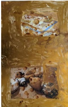
Mathis Gasser, Habitats , 2023, collage du papier, 70,1 x 44,7 cm

A travers l'art, certains artistes essaient d'imaginer le monde de demain. Les collages-peintures de Mathis Gasser mélangent des images fictionnelles et documentaires, des bâtiments terrestres et des paysages martiens. Pour réaliser ses œuvres, l'artiste collecte des images issues de la science-fiction, du cinéma, des jeux-vidéos ou encore des photographies produites par des agences spatiales. Il réutilise ensuite ces images pour composer ses collages. En jouant sur la confrontation d'espaces habités et de paysages martiens, il pose la question de l'exploration et de la conquête spatiale. S'interroger sur les conditions de vie en milieu extrême permet également d'imager des modèles possibles pour une vie sur une Terre devenue de moins en moins habitable.