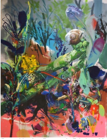
Jean-Xavier Renaud, Réchauffement climatique , 2015, huile sur toile, 340 x 270 cm

Foisonnantes de vie et de couleur, cette grande toile de Jean-Xavier Renaud reprend certains codes de représentations des natures mortes traditionnelles, tout en les réinterprétant. La présence de l'escargot se retrouve par exemple sur plusieurs natures mortes hollandaises au 17 e siècle. La scène de Réchauffement climatique , dont le titre place l'emphase sur la crise climatique en cours, mélange des animaux et des plantes avec des outils abandonnés. Dans ce paysage tropical, auquel les couleurs acidulées donnent un aspect lointain, voir extra-terrestre, la nature reste tout de même contaminée par la présence de l'être humain.