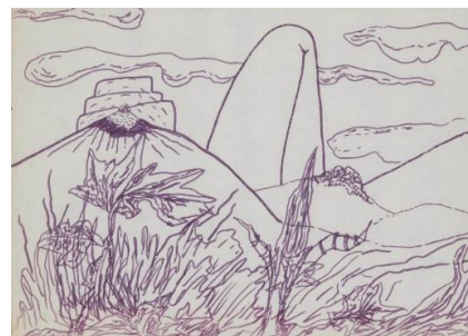
Doris Stauffer, Sans titre, non daté, Feutre sur papier