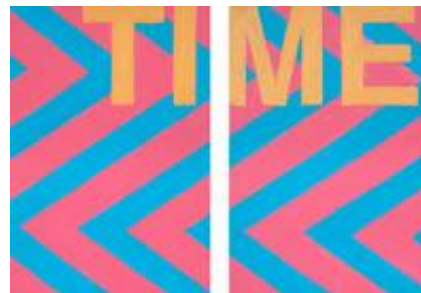
Agnès Thurnauer, Prédelle (Time #1), 2018, Acrylique sur toile ©Agnès Thurnauer