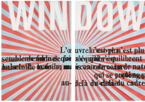
Agnès Thurnauer (*1962) Grande Prédelle (window) , 2010 Acrylique sur toile 2 x 195 x 113 cm ©Agnès Thurnauer