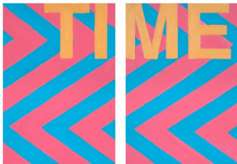
Agnès Thurnauer (*1962) Prédelle (Time #1) , 2018 Acrylique sur toile 2 x 55 x 33 cm ©Agnès Thurnauer