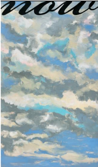
Agnès Thurnauer (*1962) Grande prédelle (Now) , 2010 Acrylique sur toile 195 x 113 cm ©Agnès Thurnauer