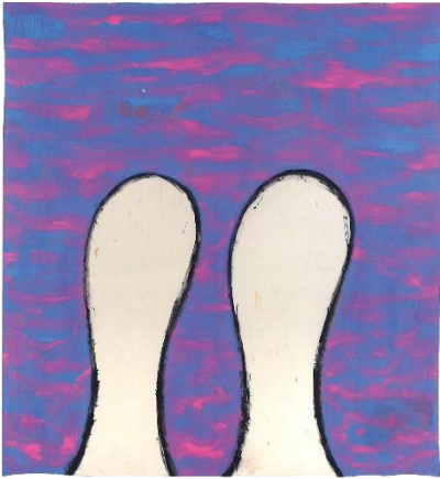
Agnès Thurnauer (*1962) Big-Big & Bang-Bang #30 , 2010 Acrylique et crayon sur toile marouflée 183 x 171 cm ©Agnès Thurnauer