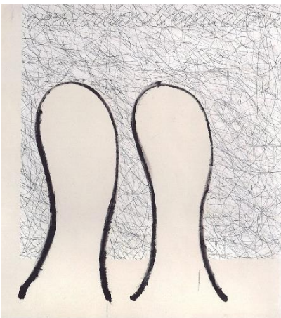
Agnès Thurnauer (*1962) Big-Big & Bang-Bang maintenant 2020 Acrylique sur toile marouflée 201 x 180.5 cm ©Agnès Thurnauer

Toutes les images et les vues d'exposition peuvent être téléchargées sur www.mbac.ch dans la rubrique « Presse ». Les images sont libres de droits pour la durée de l'exposition. Toute reproduction doit être accompagnée des mentions suivantes : nom du musée, auteur(e), titre de l'œuvre, et crédit photographique. Après parution, nous vous saurions gré de bien vouloir transmettre un exemplaire de la publication ou le lien de la mise en ligne au Musée des beaux-arts de La Chaux-de-Fonds.