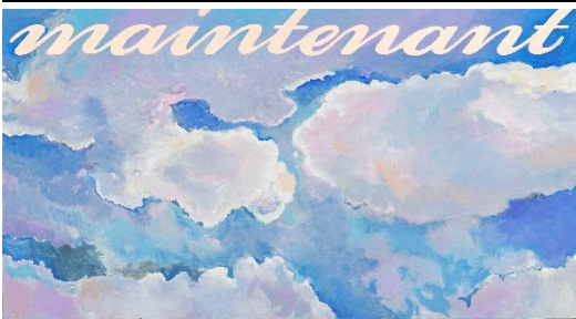
Agnès Thurnauer (*1962) Grand Prédelle (Maintenant) , 2025 Acrylique sur toile 150 x 270 cm ©Agnès Thurnauer